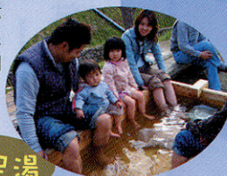
木質ペレット足湯

火の市とは、森のよさや楽しさを伝えるためのお祭りです。ペレット足湯のほか、森や木、薪や炭などに関係するグッズの販売や、炭火料理、様々な体験コーナーが楽しめます。