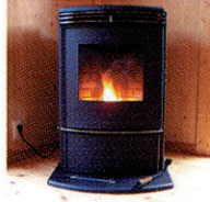
ペレットストーブ

しかし近年、地球温暖化や、森の荒廃、地産地消への取り組みが広まる中、地域の資源をペレットとして有効利用する動きが広がっています。