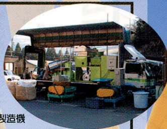
新型ペレット製造機